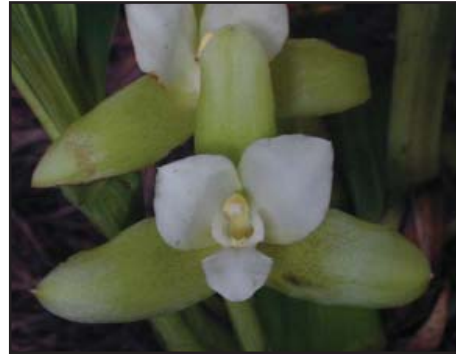
LYCASTE OCULTA 'ORQUIVALLE' Mérito Botánico

Sociedad de Orquideología de Guadalajara de Buga