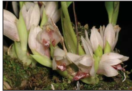
MAXILLARIA SP. 'DE ANGULO' Mérito Horticultural

Cultivador: Orquídeas del Valle Asociación Vallecaucana de Orquideología