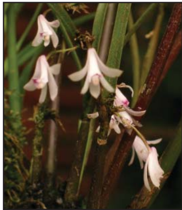
SCAPHIGLOTTIS SP. 'SADAVECA' Recomendación de Jueces