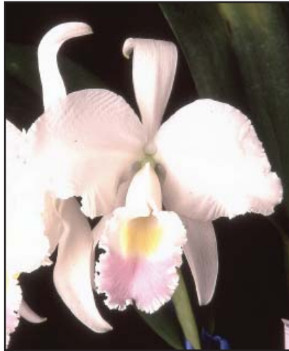
CATILEYA TRIANAE SEMIALBA CLARA CAIDAD BRONCE (78)