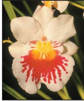
MILTONIOPSIS PHALAEOPSIS 'ANA MARÍA' Calidad Oro (90)