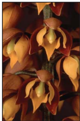
LUEDDEMANNIA PESCATOREI Calidad Plata (84)