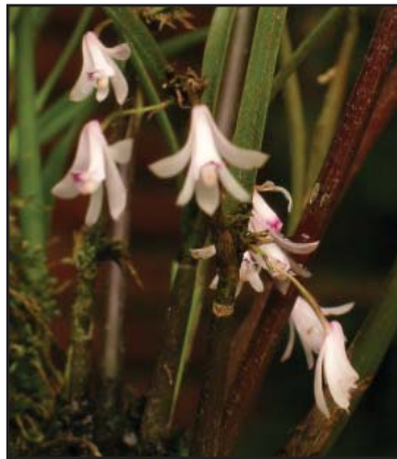
SCAPHIGLOTTIS SP. 'SADAVECA' Recomendación de Jueces