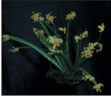
LOCKHARTIA AMOENA 'ESTALLIDO' EXCELENCIA EN CULTIVO ORO (90)