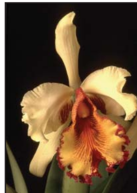
CATILEYA DOWIANA VAR. AUREA Calidad Plata (80)