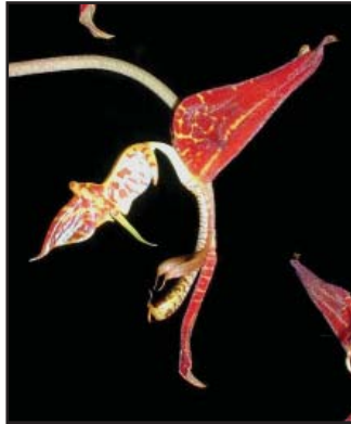
GONGORA ODORATISSIMA 'ORQUIVALLE' Calidad plata (88)