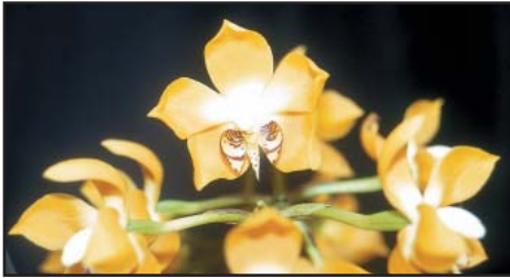
NEOMOOREA WALLISII 'MEM. RODRIGO MEJÍA' Calidad Bronce (78)