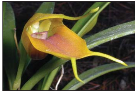
MASDEVALLIA VELLEA 'ORQUIVALLE' Mérito Botánico

Cultivador: Orquídeas del Valle Asociación Vallecaucana de Orquideología