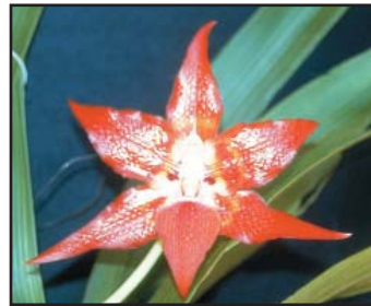
HUNTLEYA BURTII 'EDILMA' Calidad Plata (86)