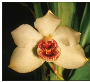
PESCATOREA KLABOCHORUM 'KATÍA'

Planta con una inflorescencia de 34 cm y tres flores bien distribuidas. Estas miden 118 mm de envergadura natural, 115 mm de altura, el sépalo dorsal 16 mm de ancho y 64 mm de alto, los pétalos 14 mm de anchos y 54 mm de altos y el labelo 25 mm de ancho y 38 mm de largo.