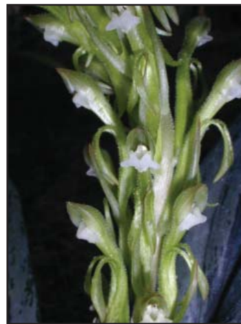
PELEXIA LAXA 'ORQUIVALLE'

Cultivador: Orquídeas del Valle Asociación Vallecaucana de Orquideología