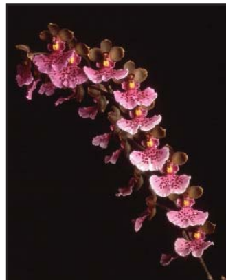
ONCIDIUM MIMETICUM Calidad Oro (93)