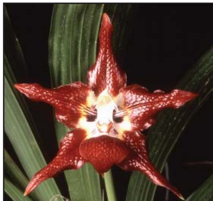
HUNTLEYA MELEAGRIS 'ANGELA MARÍA' Calidad Plata (84)