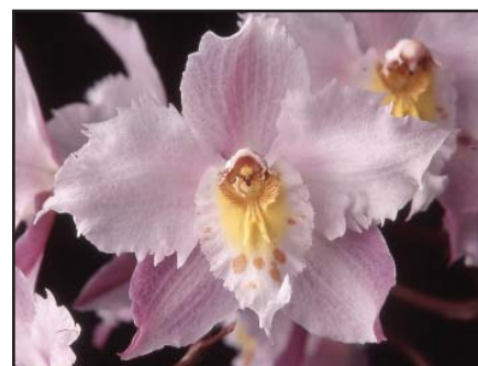
ODONTOGLOSSUM CRISPUM TIPO PACHO