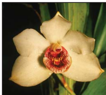
PESCATOREA KLABOCHORUM 'KATÍA'

Planta con una inflorescencia de 34 cm y tres flores bien distribuidas. Estas miden 118 mm de envergadura natural, 115 mm de altura, el sépalo dorsal 16 mm de ancho y 64 mm de alto, los pétalos 14 mm de anchos y 54 mm de altos y el labelo 25 mm de ancho y 38 mm de largo.