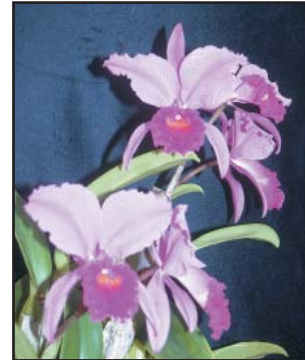
CATLEYA TRIANAE VAR. SANGRE DE TORO 'ORQUIVALLE' CALIDAD PLATA (84)