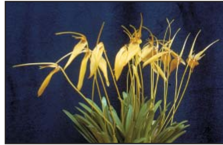
BARBOSELLA LONGIPES 'TÚ Y YO' Calidad Plata (87)