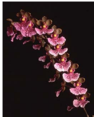
ONCIDIUM MIMETICUM Calidad Oro (93)