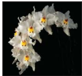
ODONTOGLOSSUM CRISPUM EL DORADO Calidad Oro (91)