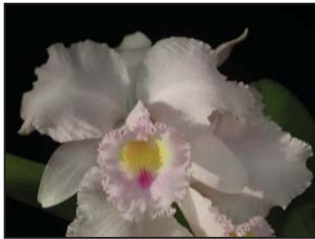
CATLEYA TRIANAE cuasiconcolor Mai Calidad (88) Plata