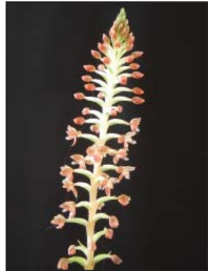
CRANICHIS CILIATA Martín Recomendación de Jueces