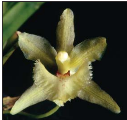
KEFERSTEINIA TOLIMENSIS semi alba Santiago Recomendación de Jueces