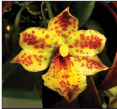
TRICHOCENTRUM PULCHRUM Manzur'