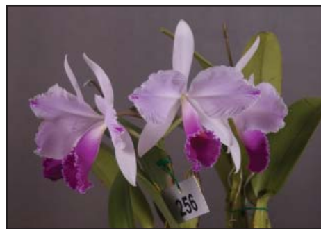
CATTLEYA TRIANAE pincelada Centella Calidad Plata (80)