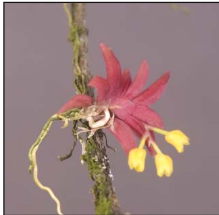
PTEROSTEMMA ANTIOQUENSIS Fizebad Mérito Botánico