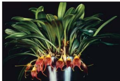
MASDEVALLIA ANGULATA Valentina Excelencia en Cultivo Plata (86)