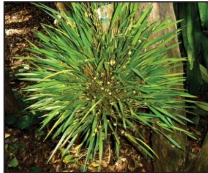
OCTOMERIA SP. Adelaida

Asociación Risaraldense de Orquideología