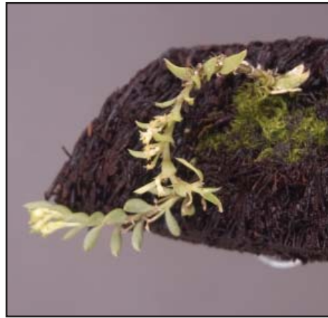
PACHYPHYLLUM SP. Mérito Botánico