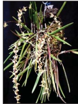
EPIDENDRUM MORITZII

José Fernando y Marisa Londoño. Asociación Caldense de Orquideología