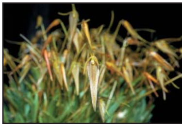
BARBOSELLA REPENS CECILIA Excelencia en Cultivo Oro (92)