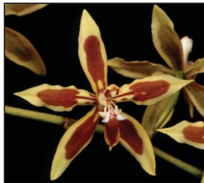
ODONTOGLOSSUM MIRANDUM Juanpa Calidad Plata (84)