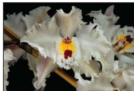
ODONTOGLOSSUM CRISPUM HELENA Recomendación de Jueces